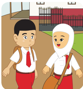
Gambar 1.8. Pulang sekolah.

Untuk lebih memahami arti Q.S. al-Kāfirūn , perhatikan dialog berikut.