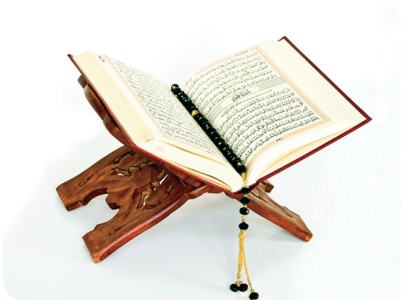
Gambar 1.3. Kitab suci al-Qur'ān .

Surat al-Kāfirūn adalah surat ke-109. Jumlah ayat surat al-Kāfirūn 6 (enam) ayat. Surat al-Kāfirūn mengisyaratkan tentang pupusnya harapan orang-orang kafir Qurays Mekah zaman itu terhadap dakwah Nabi Muhammad saw. Nabi Muhammad saw. tidak mau mengikuti tata cara beribadah orang-orang kafir Quraishy . Mereka dipersilakan beribadah menurut ajaran agamanya sendiri. Surat al-Kāfirūn tergolong surat Makkiyah karena diturunkan di Kota Mekah sesudah surat al-Mā'ūn . Dinamai " al-Kāfirūn " (orang-orang kafir) diambil dari perkataan " al-Kāfirūn " yang terdapat pada ayat pertama surat ini.