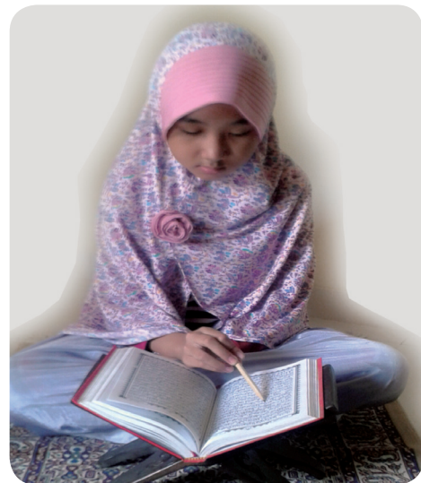
Gambar 1.4. Adab membaca al-Qur'ān