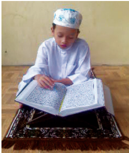
Gambar 6.1 anak sedang membaca Al Qur'an

Amati dan bacalah al-Qur'ān Surat al-Mā'ūn di bawah ini dengan baik.